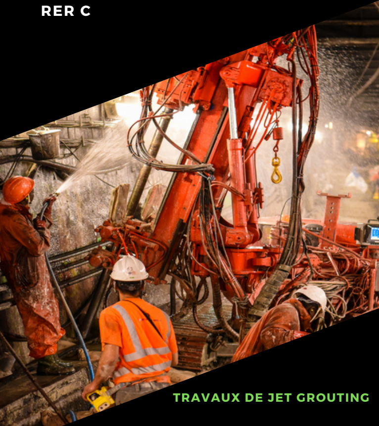
TRAVAUX DE JET GROUTING

MIRR est votre partenaire stratégique dans l'ordonnancement, le pilotage et la coordination des projets.